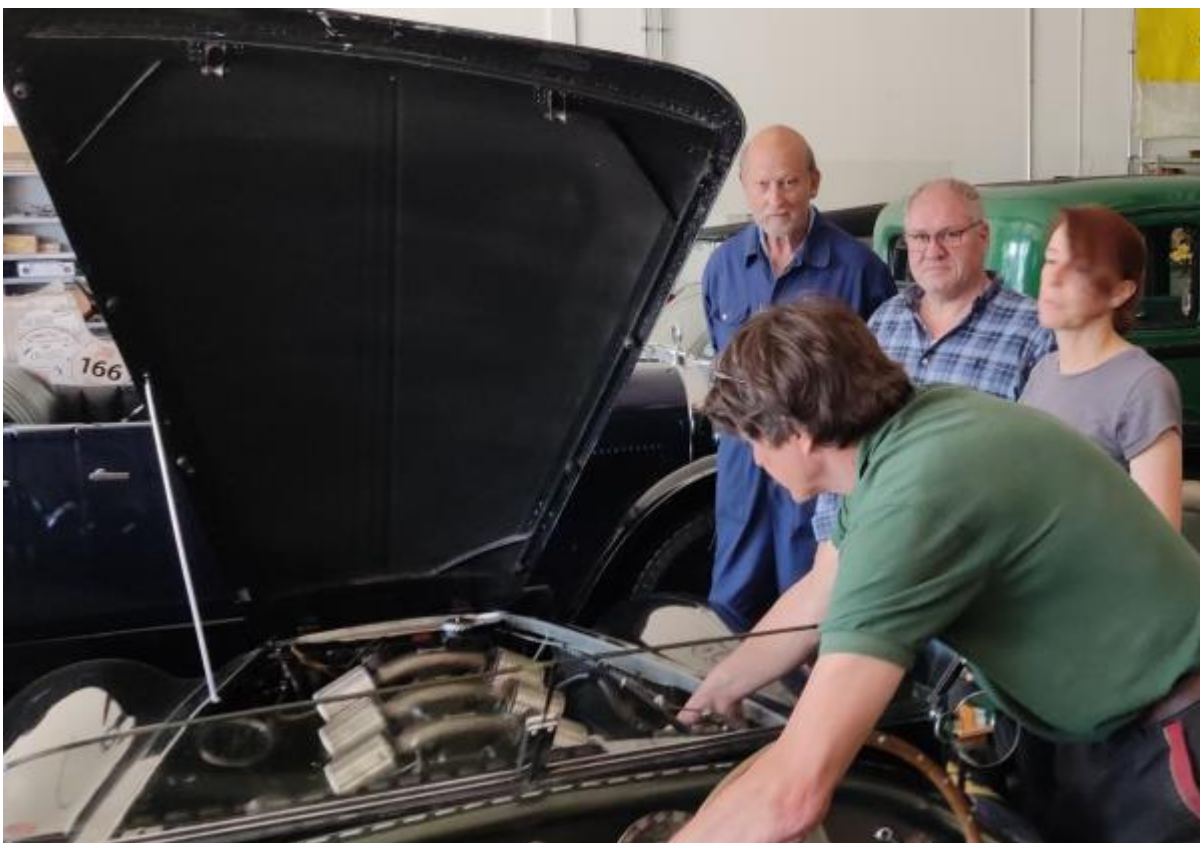
Oldtimer in der Praxis Zum Abschluss des Lehrganges (Roger ist leider verhindert)