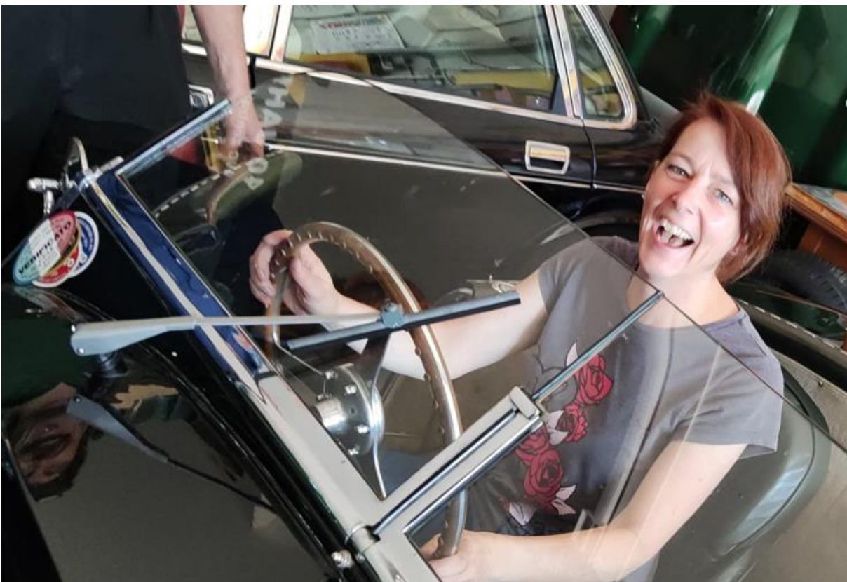
Oldtimer in der Praxis Susanne versucht sich an der der Kupplung